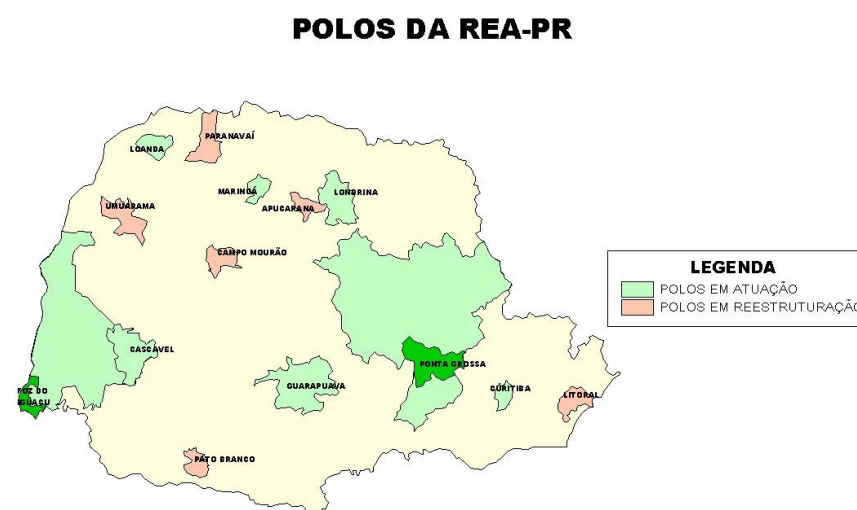
Figura 1 – mapeamento dos pólos regionais da REA-PR

regionais, foi possível sensibiliza-los e mobiliza-los para a efetividade da participação dos facilitadores de cada pólo. Como resultados desses encaminhamentos, obtiveram-se os dados para o mapeamento da situação real de cada pólo, bem com a espacialização no estado do Paraná, conforme a figura 1.