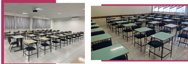
Foto: 450 unidades de Cadeiras Estofadas Curso de Nutrição (CCS) e Direito (CCSA) - Recursos Custeio 2019

Foram substituídas 450 cadeiras em 9 (nove) salas de aula atendendo os cursos de Direito (CCSA) e Nutrição (CCS). Os recursos para esta ação foram viabilizados por meio de economia do orçamento e financeiro do custeio de 2019 (Gestão Prof. Gilmar). A referida ação foi viabilizada e executada em 2020 em parceria com o Campus de Cascavel e teve um investimento de R$ 50.000,00 (cinquenta mil reais).