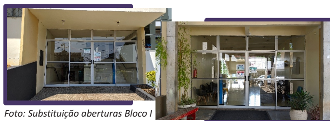
Foto: Substituição aberturas Bloco I