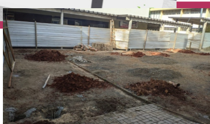
Foto: Início das obras em 07-12-2020

A Missão da Unioeste como instituição pública, multicampi, é produzir, sistematizar e socializar o conhecimento, contribuindo com o desenvolvimento humano, científico, tecnológico e regional, comprometendo-se com a justiça, a democracia, a cidadania e a responsabilidade social.