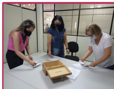
Processo Eleitoral - Comissão de escrutinação