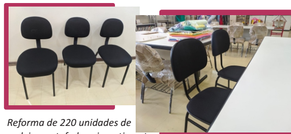
Reforma de 220 unidades de cadeiras estofadas - investimento de R$ 18.260,00

Durante o mesmo período, Direções de Centro, Colegiados de curso de Graduação e Pós-graduação, e Grupos de Pesquisa também investiram recursos próprios na melhoria das estruturas utilizadas para atividades de ensino, pesquisa e extensão.