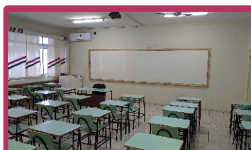
Colegiado Curso de Direito investiu em mobiliário para sala de aula, sala dos professores e adquiriu equipamentos para auxiliar o curso nas atividades remotas síncronas.

Durante o mesmo período, Direções de Centro, Colegiados de curso de Graduação e Pós-graduação, e Grupos de Pesquisa também investiram recursos próprios na melhoria das estruturas utilizadas para atividades de ensino, pesquisa e extensão.