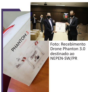
Foto: Recebimento Drone Phanton 3.0 destinado ao NEPEN-SW/PR

O Campus recebeu equipamentos e materiais de informática por meio de processo de doação da Receita Federal do Brasil. A doação foi realizada à Unioeste que fez a divisão e destinação aos Campi. O Campus de Francisco Beltrão recebeu equipamentos médicos os quais foram destinados aos CCS, materiais para a Divisão e Informática e um equipamento Drone (Phanton 3.0) destinado ao Núcleo de Estudos e Pesquisas sobre Desastres Naturais do Sudoeste do Paraná - NEPEN-SW/PR.