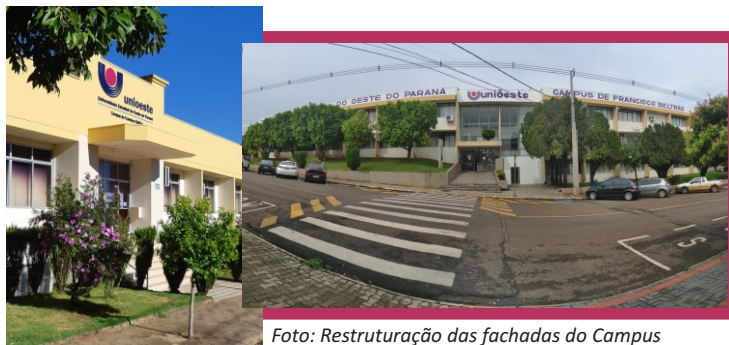
Foto: Restruturação das fachadas do Campus

Durante o período de suspensão das atividade presenciais de ensino, pesquisa e extensão, o Campus teve uma economia de recursos orçamentários e financeiros destinados a estas atividades. Os recursos desta economia foram utilizados para atender demandas de melhorias em estruturas físicas e mobiliários.