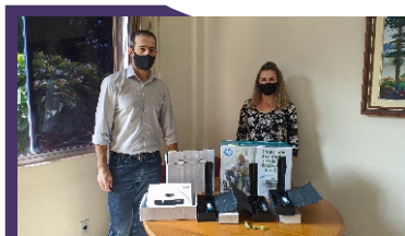
Foto: Equipamentos médicos destinados ao CCS