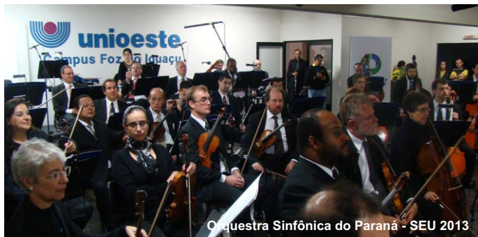
Orquestra Sinfônica do Paraná - SEU 2013