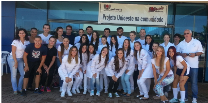
Participantes do Projeto “Unioeste na Comunidade”

30/08 - MacDia Feliz - Hospital do Câncer da Uopecan