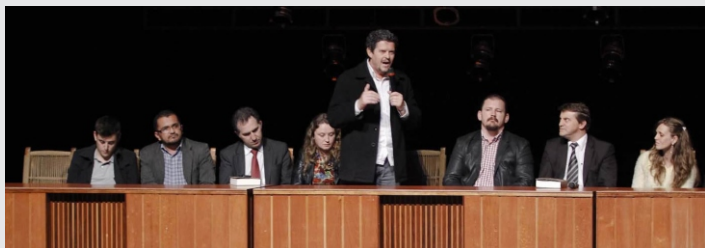
Abertura do Curta Toledo

Realizar um filme de três minutos em apenas 48 horas foi o desafio proposto às equipes inscritas no 1º Festival Curta Toledo, festival amador de curta metragem, promovido pela Secretaria de Cultura e Secretaria de Comunicação Social de Toledo em parceria com a Proex.