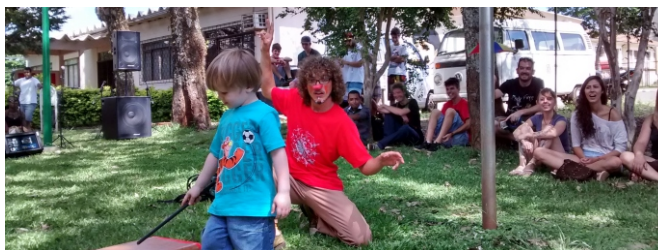
Grupo Sérico - "Inquilíbrio"